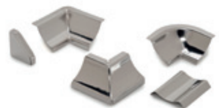
accessori acciaio inox per GIN/