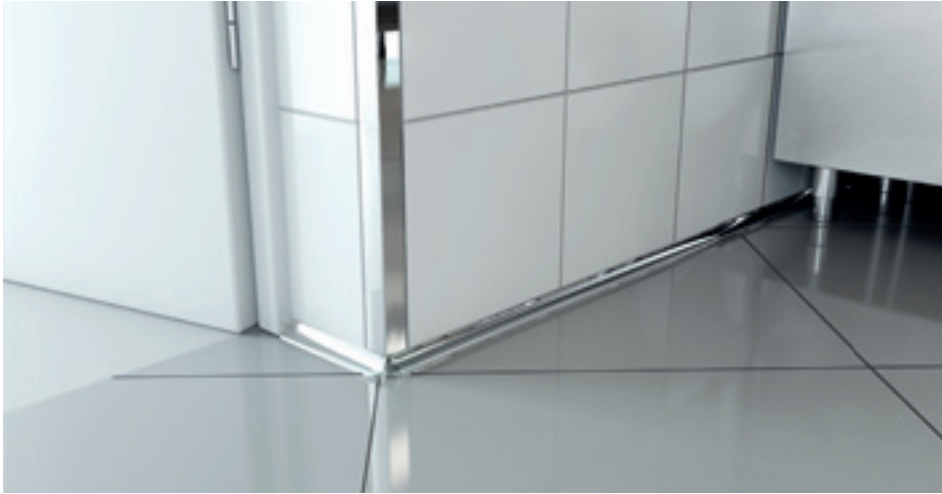
GIN/10 + ILN/10 acciaio inox lucido AISI 304 DIN 1.4301

Proround M in acciaio è un profilo di raccordo da utilizzarsi nelle situazioni in cui è richiesta una particolare tutela del livello igienico (ad esempio in studi medici, industrie alimentari, piscine, centri benessere, cucine industriali, ospedali ecc.). In particolare la versione in qualità AISI 316 DIN 1.4404 offre caratteristiche di superiore resistenza alla corrosione ed è quindi raccomandata per applicazioni in aree soggette a maggiori sollecitazioni chimiche e zone di mare.