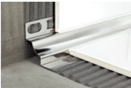
GIN/10 acciaio inox AISI 304 DIN 1.4301