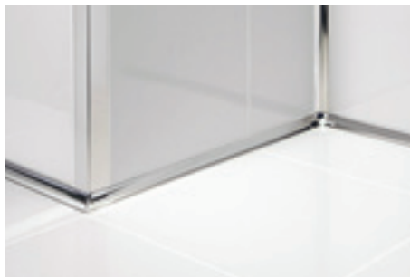
GIN/10 + ILN/10 acciaio inox AISI 304 DIN 1.4301